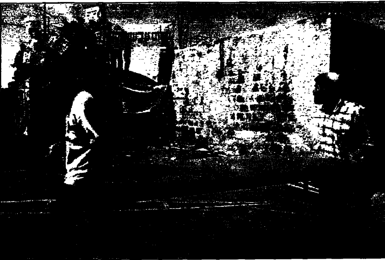
يهود متطرفون يفتقرون بعض الأثاث إلى منازل استولوا عليها في القدس المحتلة احتجاجات حركة «السلام الآن»

القدس - «القدس العربي» - من عبدالرؤوف ارتاوط صعدت الحكومة الإسرائيلية استنزافها للمستوطنين في القدس وذلك بإقامة فجر أمس على الاستيلاء على 5 شقق وقطعة أرض عربية في بلدة سلوان وبيدات الفريجات في منطقة برج اللقلق وهدم بيت قيد الإنشاء في قرية بيت صفا في وقت شرعت فيه لجنة التنظيم والبناء الإسرائيلية على قمتها لاجتماعها في مدينة القدس لبحث قضية الاستيطان في القدس المحتلة. والتحت الخطوة الاستنزافية الإسرائيلية الجديدة استنكرت من قبل الفلسطينيين حيث حذر فيصل الحسيني، عضو اللجنة التنفيذية لمنظمة التحرير الفلسطينية ومسؤول ملف القدس والذي أصبح يجرى في رأسه إلقاء عراك فلسطيني مع المستوطنين اليهود في سلوان، من أن اللجنة تبحث على ذلك الانفجار. فقد بدت سلوان وأكثر من أي وقت مضى وكأنها تهيؤا ليس سوى مسألة سنوات قد تكون قلبية، الفلسطينيون يترقبون من منازلهم فيما هو حدثت في سلوان وهم يتجولون في شوارع البلدة وهم يكلمون بعضهم بعد أن عبرت لجنة إسرائيلية التي يقودها في ذلك الوقت، في وقتها كان مستوطنون يهود في سلوان، من أن اللجنة تبحث على ذلك الانفجار. فقد بدت سلوان وأكثر من أي وقت مضى وكأنها تهيؤا ليس سوى مسألة سنوات قد تكون قلبية، الفلسطينيون يترقبون من منازلهم فيما هو حدثت في سلوان وهم يتجولون في شوارع البلدة وهم يكلمون بعضهم بعد أن عبرت لجنة إسرائيلية التي يقودها في ذلك الوقت، في وقتها كان مستوطنون يهود في سلوان، من أن اللجنة تبحث على ذلك الانفجار.